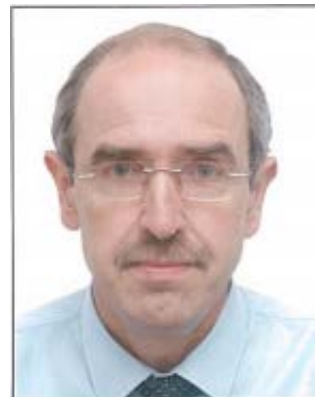
Место для фотографии